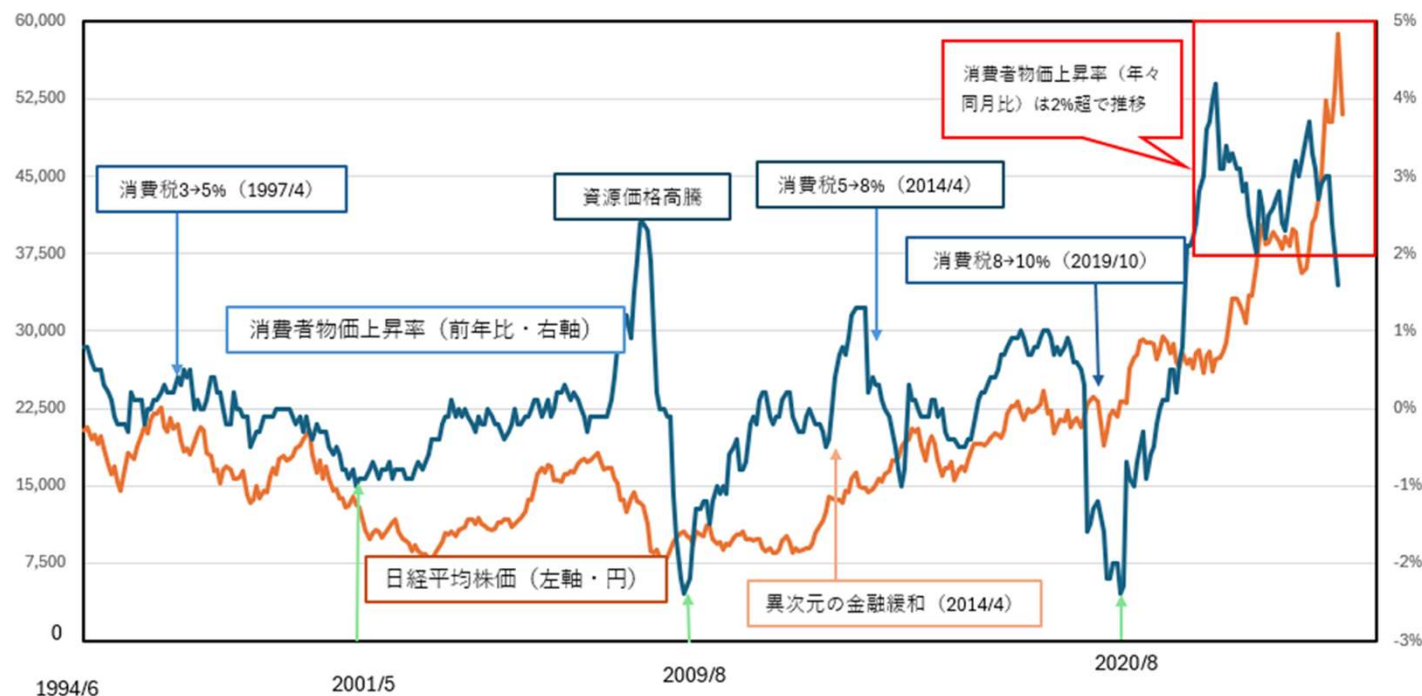
★日経平均株価(月足)と消費者物価上昇率(前年同月比)

Bloombergデータを用いてSBI証券が作成。消費者物価上昇率は生鮮食品を除いた数字。消費税率引き上げ(1997年4月2%、2014年4月3%、2019年10月2%)以降の1年間はそれぞれ消費税引き上げ分を実数から差し引いた修正値です。