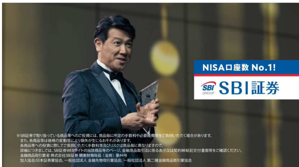
「NISA 口座数 No.1 SBI 証券」篇

株式会社 SBI 証券(本社:東京都港区、代表取締役社長:高村正人、以下「当社」)は、2021 年 8 月 13 日(金)から、俳優・別所哲也さんを起用した TVCM「NISA 口座数 No.1 ※1 SBI 証券」篇、「iDeCo 加入者数 No.1 ※2 SBI 証券」篇、「取引シェア No.1 ※3 SBI 証券」篇の放映を開始します。また、放映に先駆けて 2021 年 6 月 25 日(金)から YouTube で先行公開し、2021 年 7 月 5 日(月)から都内タクシーCM を開始します。