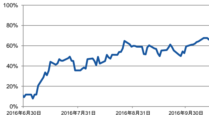
図1: 米国年内利上げ確率

期間: 2016年6月30日から2016年10月14日までの日次データ。