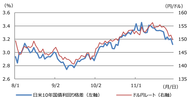
【図表1：日米10年国債利回り格差とドル円レート】

(注) データは2024年8月1日から11月29日。日米10年国債利回り格差は米国10年国債利回りから日本10年国債利回りを差し引いたもの。