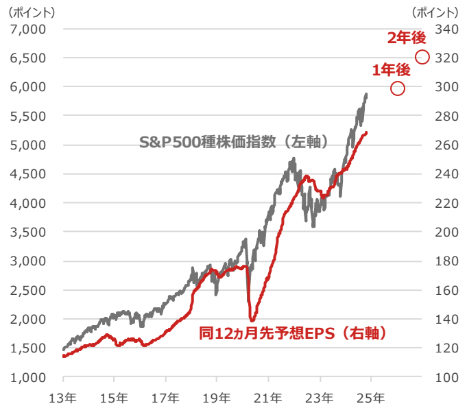
S&P500種株価指数と 同12ヵ月先予想EPS（1株当たり利益）

期間：2013年1月4日～2024年10月30日、週次 ・○印は1年後、2年後の12ヵ月先予想EPS（2024年10月30日時点）