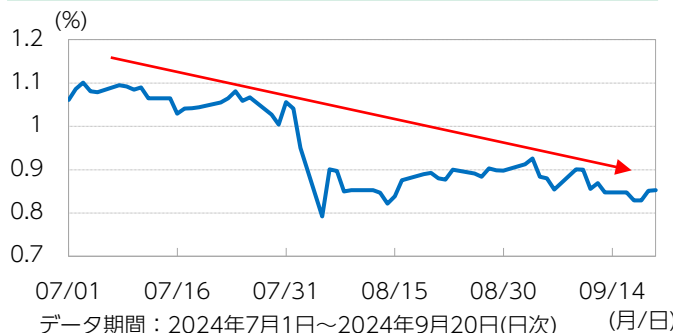
図表3：日経平均株価、米ドル/円相場の動向