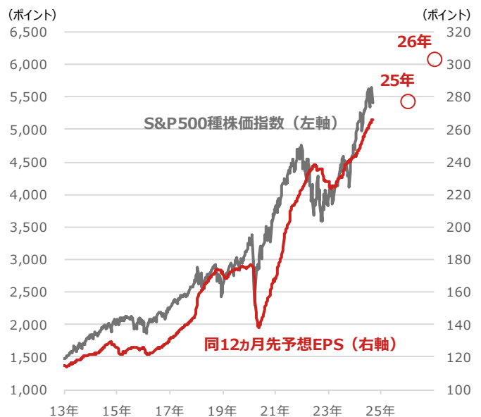
S&P500種株価指数と 同12カ月先予想EPS（1株当たり利益）

期間：2013年1月4日～2024年9月6日、週次 ・○印は2025年、2026年のBloomberg予想（2024年9月6日時点）