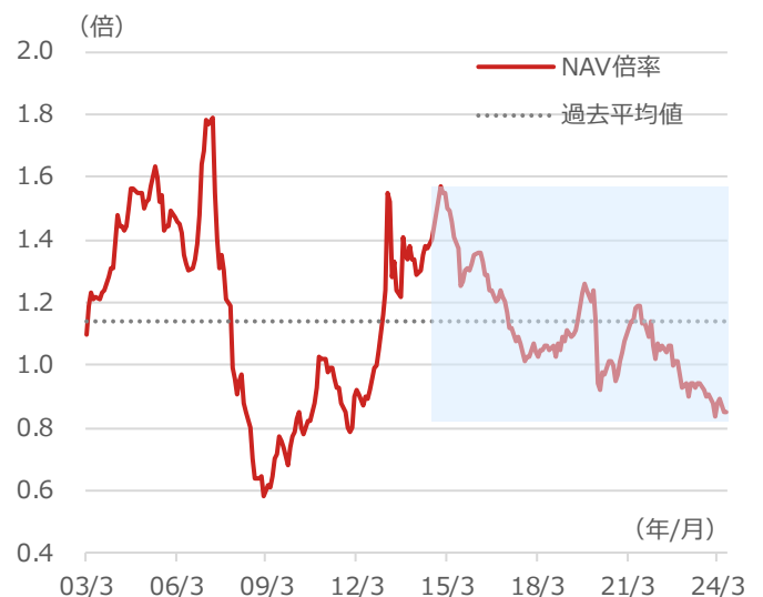
期間：2003年3月末～2024年6月末、月次 過去平均値：2003年3月末～2024年6月末の平均値 (1.14) ・NAV倍率：リート全銘柄の「投資口価格÷1口当たりNAV」の時価総額加重平均値。 ・NAV：純資産価値。純資産に保有物件の含み損益を加えた金額。

上記は過去のデータであり、将来の投資成果を示唆あるいは保証するものではありません。