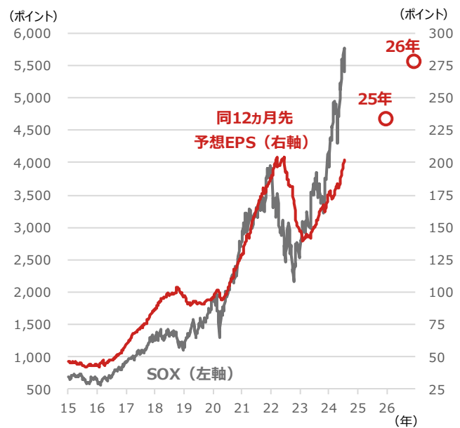
SOXと同12か月先予想EPS（1株当たり利益）

期間：2015年1月2日～2024年7月17日、週次 ・○印は2025年、2026年のBloomberg予想（2024年7月17日時点） （出所）Bloombergより野村アセットマネジメント作成