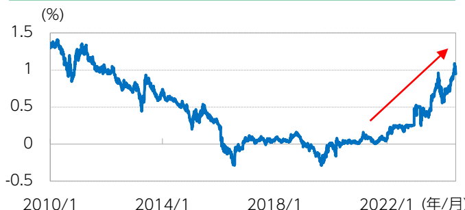
図表2：国内10年国債の利回り推移

※その後については、金融市場において長期金利がより自由な形で形成されるよう、長期国債買入れを減額していく方針。次回金融政策決定会合において、今後1～2年程度の具体的な減額計画を決定する。