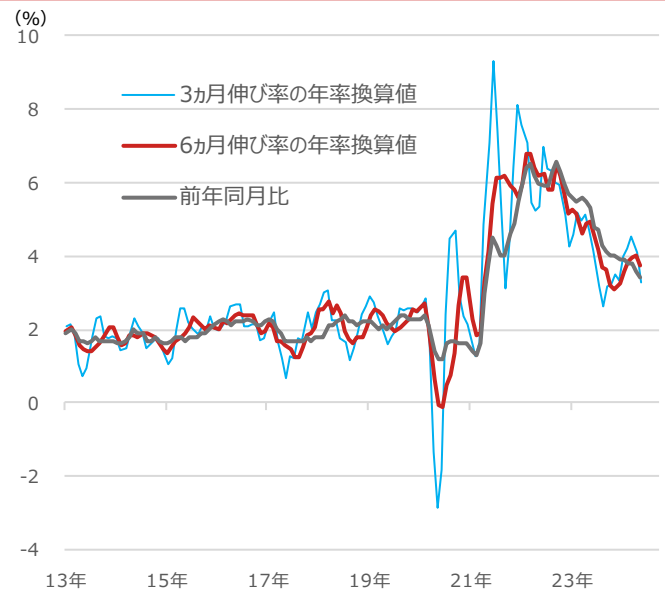
米コアCPI（消費者物価指数）の伸び率

期間：2013年1月～2024年5月、月次