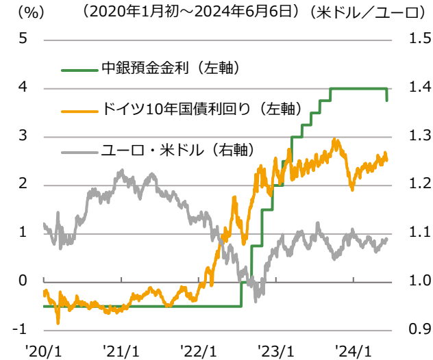
※中銀預金金利は発表日ベース