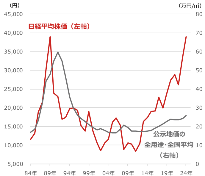
日経平均株価と公示地価の全用途・全国平均

期間：（日経平均株価）1984年末～2024年6月3日、年次 （公示地価の全用途・全国平均）1984年～2024年、年次