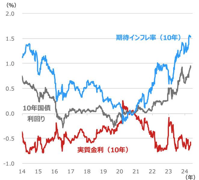
日本の実質金利・10年国債利回り・期待インフレ率

期間：2014年1月3日～2024年5月14日、週次 ・期待インフレ率 = 10年国債利回り－物価連動国債（10年）利回り ・実質金利は物価連動国債（10年）利回りをを用いた （出所）Bloombergより野村アセットマネジメント作成