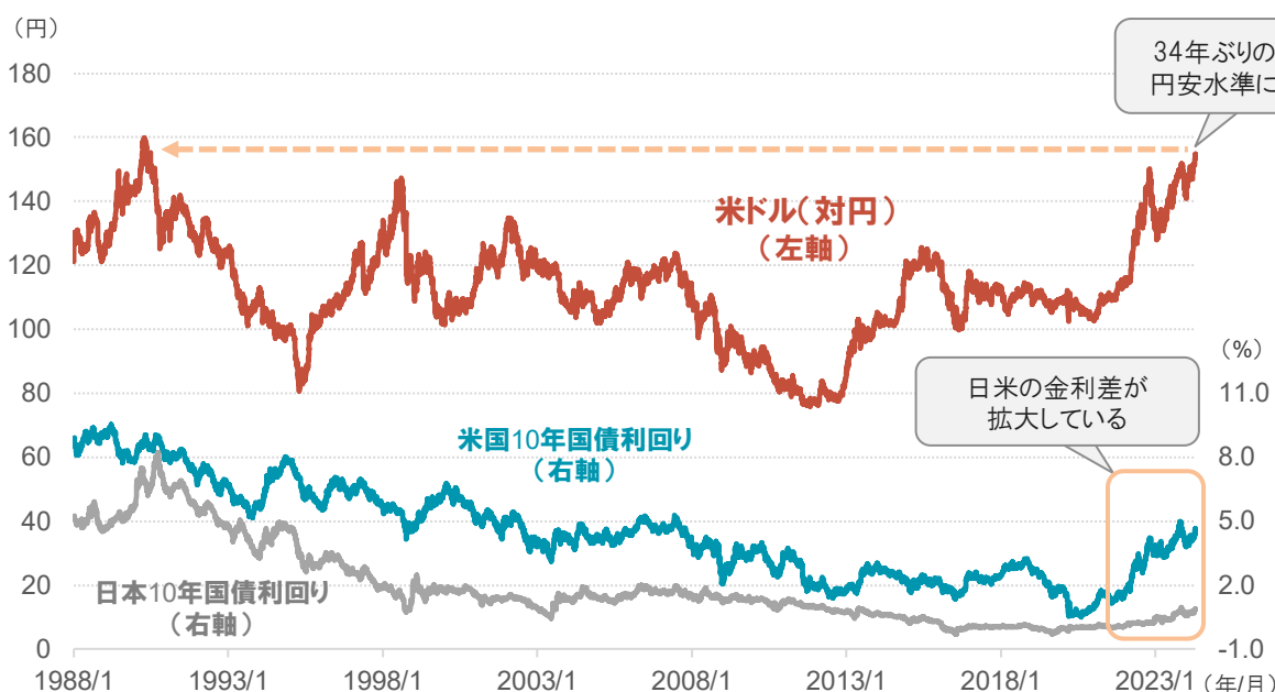
■米ドル(対円)と日米10年国債利回りの推移(期間:1988年1月1日～2024年4月19日)

コールセンターには、米国をはじめとする、海外資産に投資する投資信託を保有されている方から、「だいぶ円安も進んだし、一旦売却した方がよいか」というご相談が増えています。そこで今回は、あらためて投資信託の基準価額の算出の仕組みを整理したうえで、 長期の資産運用で投資信託を活用する際の大事な視点についてお話ししたいと思います。