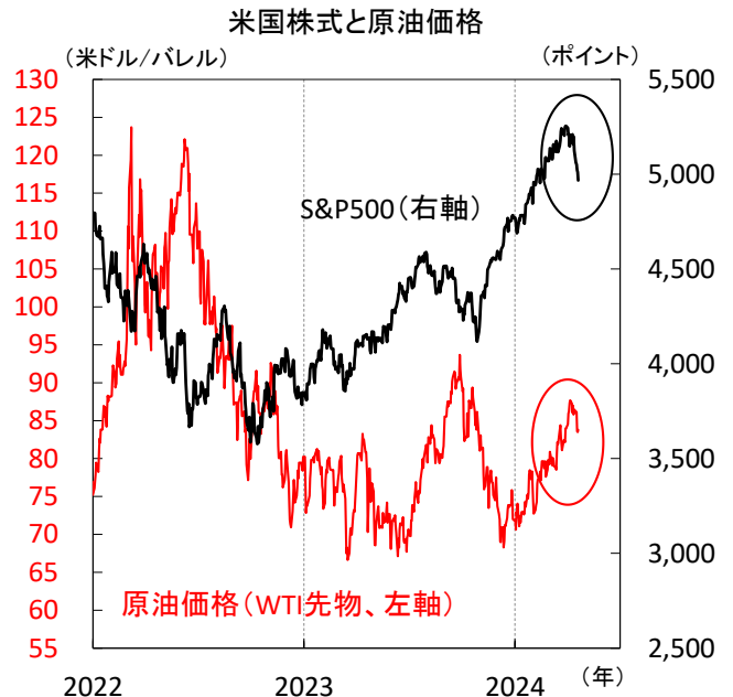
【図1】 昨年終盤からじり高基調の原油価格、今年4月から上値を重くする米国株式

米利下げ観測や地域紛争を巡る不透明感が渦巻くなか、高めのインフレや金利を、強い景気の裏返しと冷静に見られるかが株価安定の鍵といえます。スタグフレーション（景気悪化・インフレ加速）的な動きが強まらないかを含め、今後の経済指標から、底堅い景気とインフレ収束傾向が確認できるかが焦点です（図2）。（瀧澤）