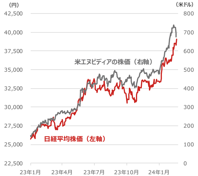
日経平均株価と米エヌビディアの株価

期間：（日経平均株価）2023年1月4日～2024年2月22日、日次 （米エヌビディアの株価）2023年1月4日～2024年2月21日、日次