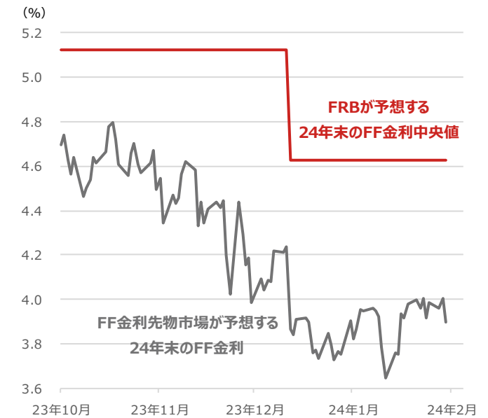
FF金利の24年末時点の予想水準

期間：2023年10月2日～2024年1月31日、日次 ・FF金利はフェデラルファンド金利 ・FRBが予想する24年末のFF金利中央値は23年9月FOMC、12月FOMCで示されたFF金利予想値を用いた