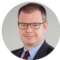
ジョン・バルディ

進化する米国株式のインカムの動向を検証し、不確実な経済・市場環境の中でリスク管理を図りながら、インカム収益と資産成長を獲得するための戦略を紹介します。