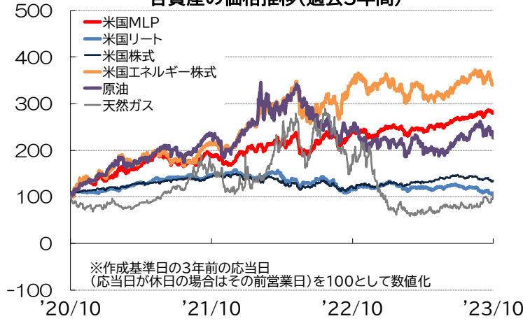
各資産の価格推移(過去3年間)