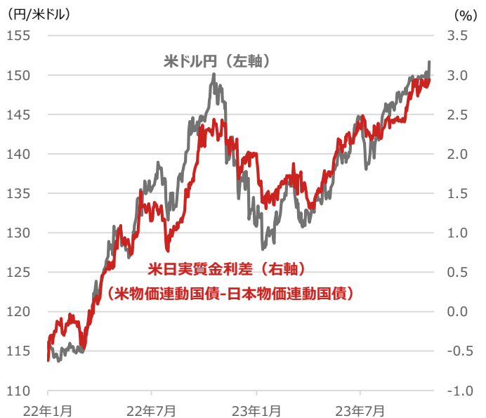
米日実質金利（10年）差と米ドル円

期間：2022年1月3日～2023年10月31日、日次 ・米日実質金利差は物価連動国債（10年）利回りをを用いた（出所）Bloombergより野村アセットマネジメント作成