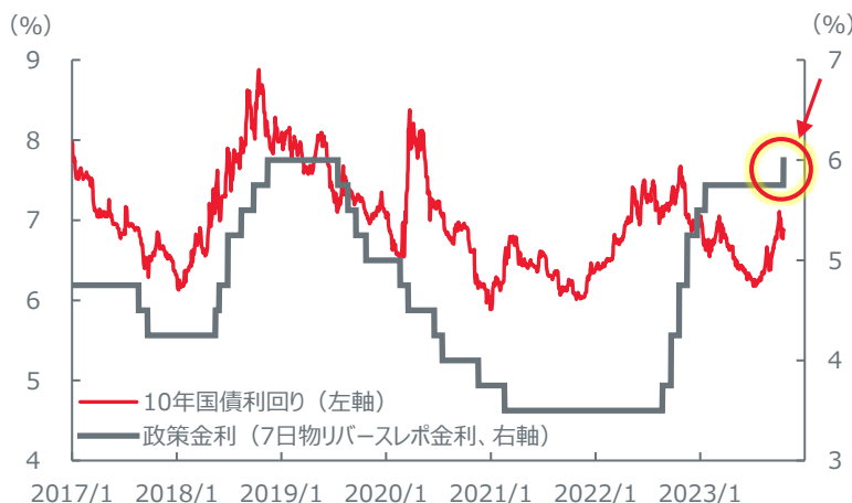
【政策金利と債券利回り】 政策金利とインドネシア10年国債利回りの推移 (2017年1月2日～2023年10月19日)