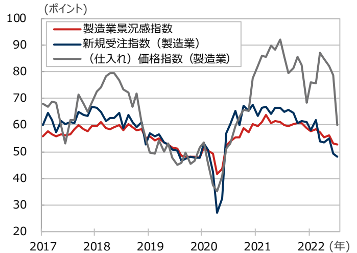
米ISM製造業景況感指数の推移

期間：2017年1月～2022年7月、月次