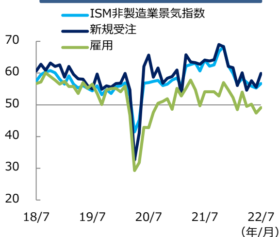
ISM非製造業景気指数の推移（1）

こうしたことから、ISM非製造業景気指数は予想外に上昇したものの、今後の動向に注視が必要です。