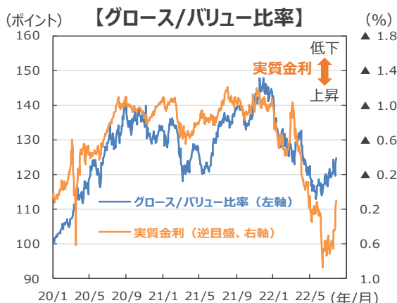
(注) データは2020年1月2日～2022年7月29日。グロス/バリュース比率はS&P500グロス指数と同バリュース指数を用い、2020年1月2日 = 100。実質金利は米10年国債利回り-期待インフレ率。 (出所) FactSetのデータを基に三井住友DSアセットマネジメント作成