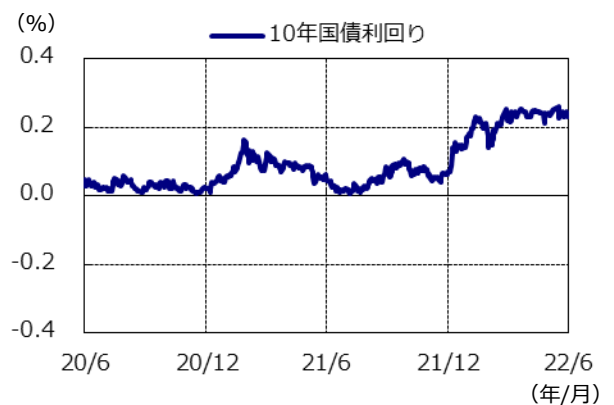
10年国債利回りの推移