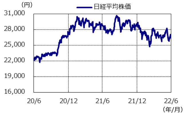
日経平均株価の推移