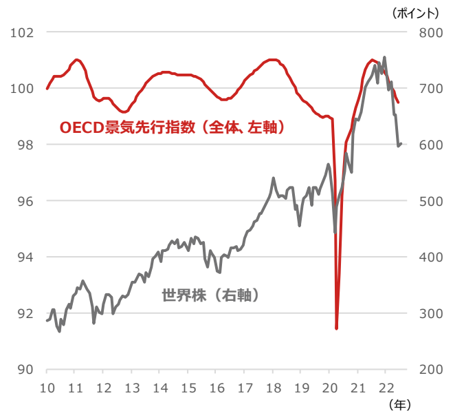
OECD景気先行指数と世界株

期間：（OECD景気先行指数）2010年1月～2022年6月、月次 （世界株）2010年1月末～2022年7月11日、月次 ・世界株はMSCI All Country World Index、米ドルベース