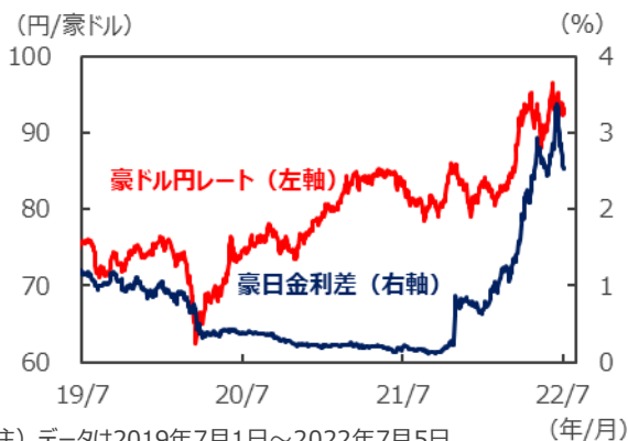
【豪ドル円レートと豪日金利差】

(注) データは2019年7月1日～2022年7月5日。 豪日金利差は2年国債利回りの差。 (出所) Bloombergのデータを基に三井住友DSアセットマネジメント作成