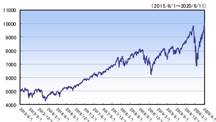
ナスダック総合指数