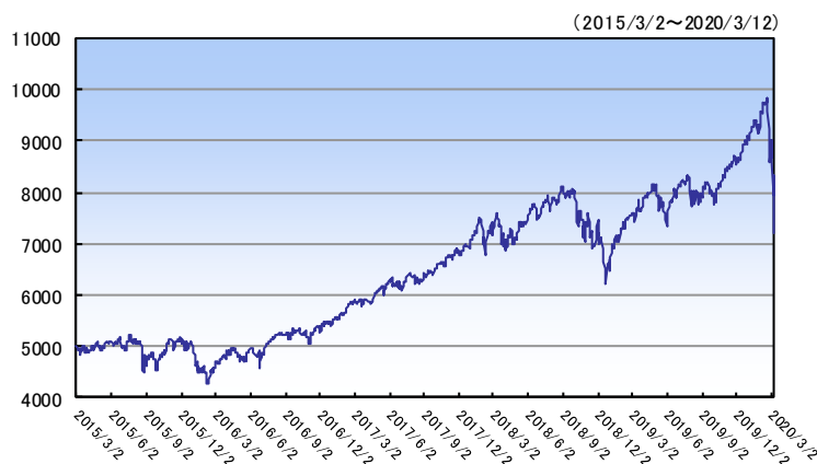
ナスダック総合指数