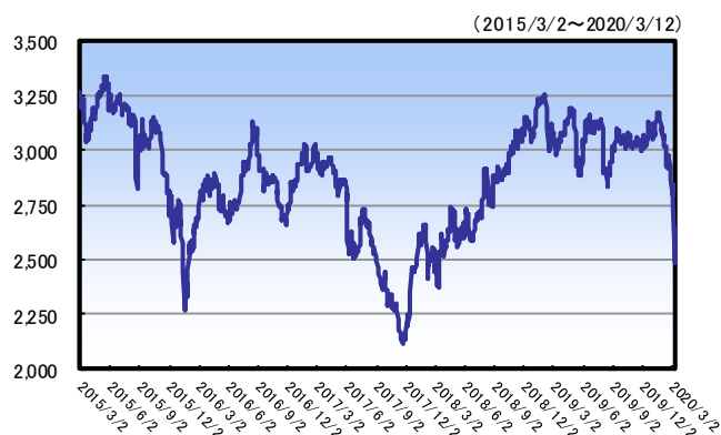
カタールQE全株指数