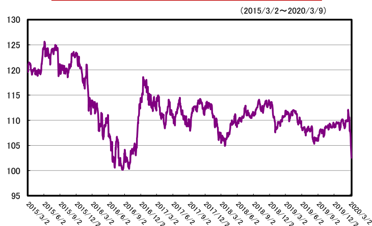
ドル/円(ロンドン・フィキシング)