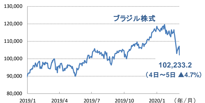
図1: ブラジル株式とブラジル・リアル(対円)の動向

※基準価額算出に用いられる株式価格は、前日の海外市場の終値が適用されます。上記海外市場の株価指数において日本の営業日に応答する海外市場が休日の場合、その前日の指数を提示しています。為替は当日のレートが適用されます。