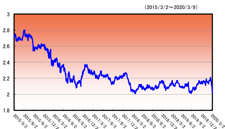
フィリピン・ペソ/円(仲値)