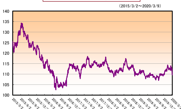
スイス・フラン/円(仲値)