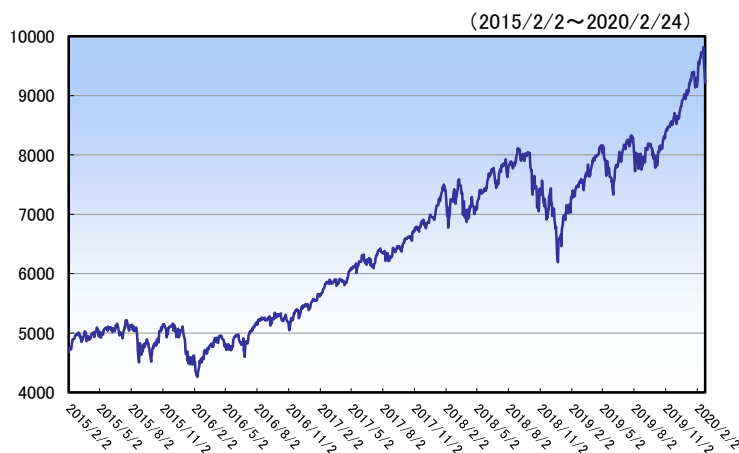
ナスダック総合指数