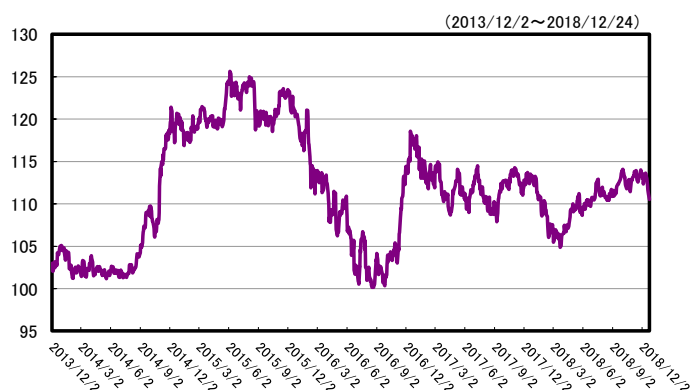
ドル/円(ロンドン・フィキシング)