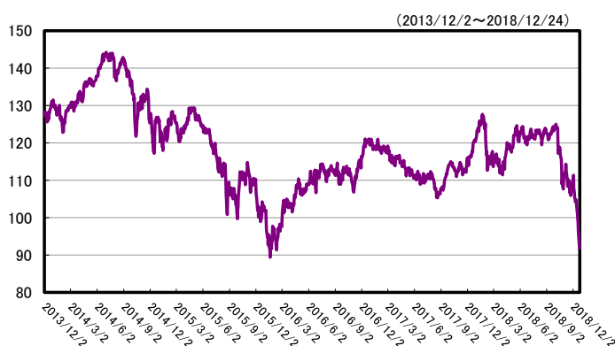
ブルームバーグテキサス州インデックス