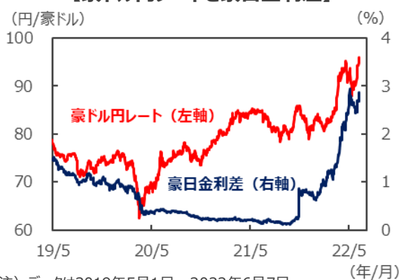
【豪ドル円レートと豪日金利差】

(注) データは2019年5月1日～2022年6月7日。 豪日金利差は2年国債利回りの差。