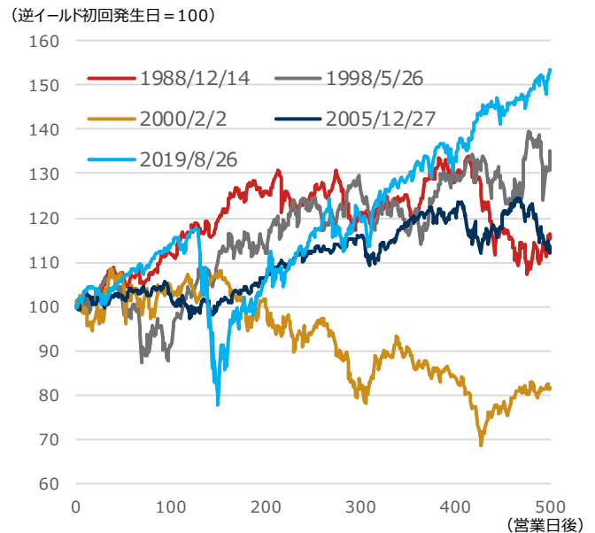
期間：逆イールド初回発生日を0営業日としたその後500営業日、日次 ・逆イールドとは短期金利が長期金利を上回る状態を指す。今回は米2年国債利回り（短期金利）と米10年国債利回り（長期金利）を比較した ・1988年以降過去5回の逆イールド示現局面のS&P500種株価指数の動き