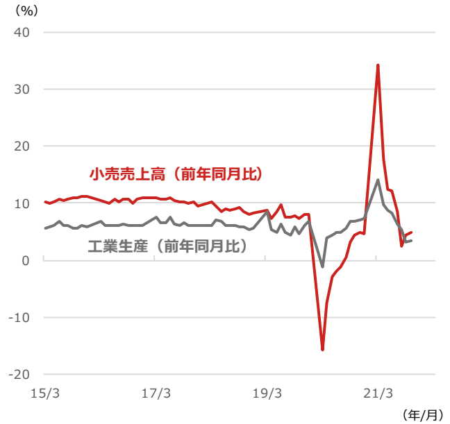
中国小売売上高・工業生産（前年同月比）

期間：2015年3月～2021年10月、月次 ・小売売上高、工業生産ともに各年1月、2月の単月統計が公表されていないため3月～12月の数字でグラフ化している (出所) Bloombergより野村アセットマネジメント作成