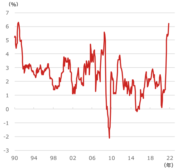
米CPI（消費者物価指数）

期間：1990年1月～2021年10月、月次 （出所）Bloombergより野村アセットマネジメント作成