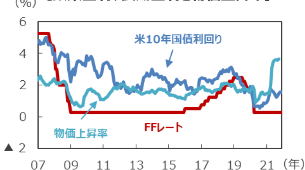
【政策金利、長期金利と物価上昇率】

(注1) FFレート、米10年国債利回りは2007年1月～2021年11月。2008年12月以降のFFレートは誘導レンジの上限を表示。 (注2) 物価上昇率は個人消費支出（PCE）コア物価指数の前年同月比。2007年1月～2021年9月。