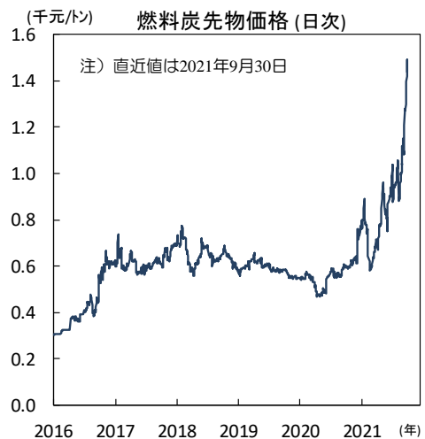
【図2】 発電用石炭の供給が不足し価格が高騰