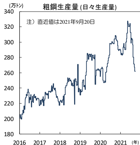
【図3】 電力不足の影響などから粗鋼生産量が減少