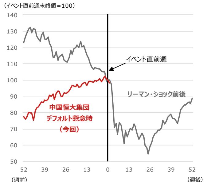
期間：(リーマン・ショック前後) 2007年9月14日～2009年9月11日、週次 (今回) 2020年9月18日～2021年9月20日、週次 ・(リーマン・ショック直前週) 2008年9月12日 ・(中国恒大集団デフォルト懸念直前週) 2021年9月17日 ・世界株：MSCI All Country World Index