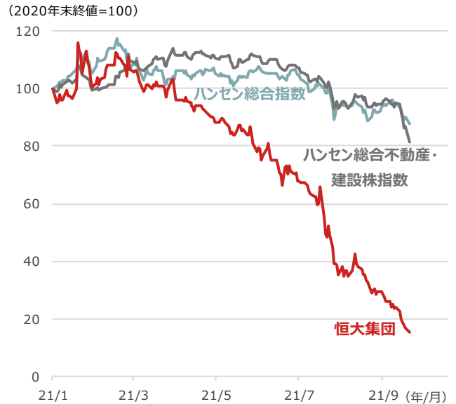
期間：2020年末～2021年9月20日、日次 ・2020年末終値 = 100として指数化