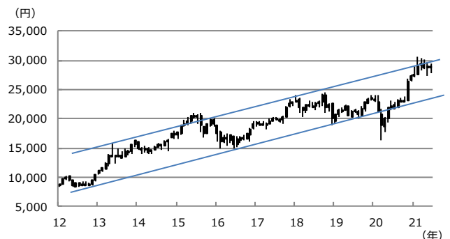
【図表2：日経平均株価の上昇トレンド】

(注) データは2012年1月から2021年6月。ローソク足は月足。上値抵抗線は2013年5月高値と2018年1月高値を結んだ線。下値支持線は2012年10月安値と2016年6月安値を結んだ線。 (出所) Bloombergのデータを基に三井住友DSアセットマネジメント作成