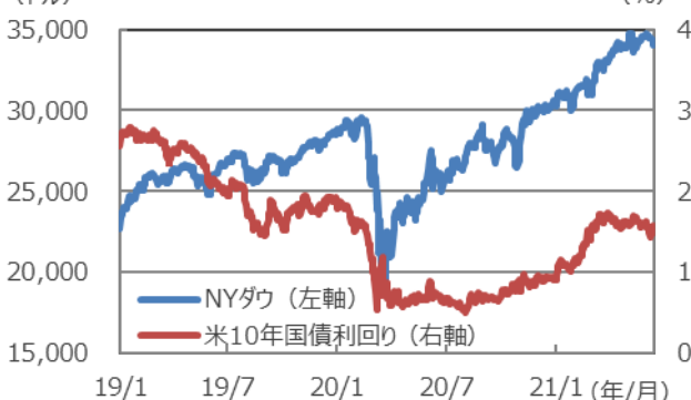
【NYダウと米長期金利】

(注) データは2019年1月～2021年6月16日。