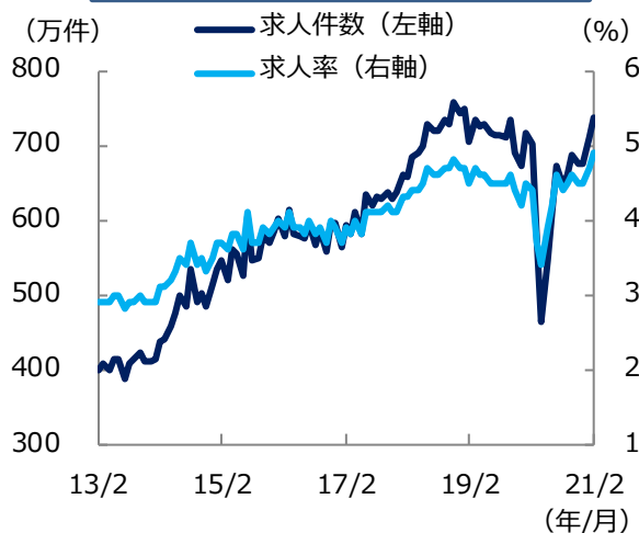
米 求人件数と求人率の推移

こうした足もとの米国の雇用改善の背景には、個人に対する1,400米ドルの直接給付を柱とした1兆9,000億米ドル規模の追加経済対策が景気を先行き押し上げるとの見方が挙げられ、今後の雇用の動向が注目されます。