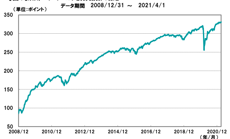
【図1】欧州ハイ・イールド債券指数の推移