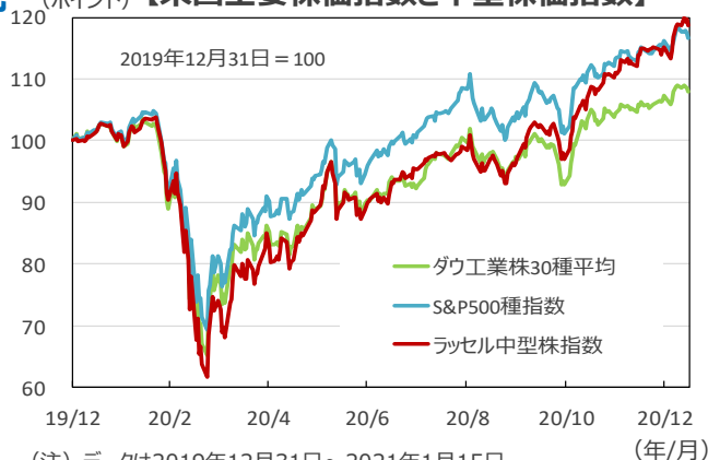
【米国主要株価指数と中型株価指数】