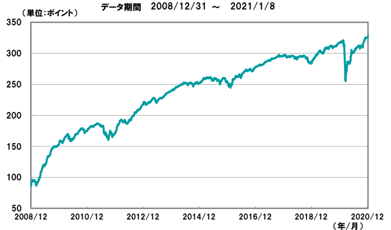
【図1】欧州ハイ・イールド債券指数の推移